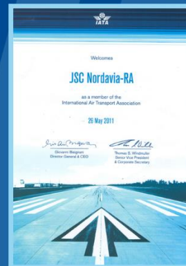
Сертификат члена IATA;